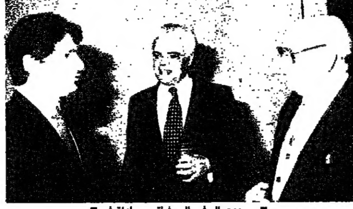
رئيس الجمهورية مع السفير السوداني بلوثوميو